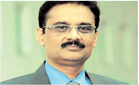
लॉ। आज जालंधर और उसके आसपास के इलाकों में मित्तल परिवार के दस से ज्यादा स्वीट स्टोर हैं। साथ ही परिवार ने बेकरी का काम भी शुरू किया है।

नई दिल्ली, एजेंसी। लवली प्रोफेशनल यूनिवर्सिटी यह देश की सबसे बड़ी यूनिवर्सिटीज में से एक है। इसमें देश-विदेश के करीब 35,000 बच्चे पढ़ते हैं। जालंधर में इस यूनिवर्सिटी का कैम्पस 600 एकड़ में फैला है। तब से मान्यता प्राप्त इस यूनिवर्सिटी में डिप्लोमा और ग्रेजुएशन से लेकर डॉक्टरेट तक 200 से ज्यादा कोर्स संचालित होते हैं। जब अशोक कुमार मित्तल ने इस यूनिवर्सिटी की शुरुआत की थी तो कुछ लोगों ने उनका मजाक उड़ाते हुए कहा था कि लड्डू बेचने वाले अब छिड़ी बंटेंगे। आज इस विश्वविद्यालय की अमेरिका, इंग्लैंड, ऑस्ट्रेलिया, कनाडा, सिंगापुर, किंगडम ऑफ द नॉर्स, स्पेन और पोलैंड की प्रतिष्ठित यूनिवर्सिटीज के साथ पार्टनरशिप है। इसे बेस्ट प्राइवेट यूनिवर्सिटी का अवार्ड भी मिल चुका है। अशोक कुमार मित्तल पंजाब से आम आदमी पार्टी के राज्य सभा के सदस्य भी हैं।