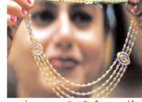
उछल के साथ 29.60 डॉलर प्रति औंस पर आ गई है, जो 2021 के बाद सबसे अधिक है।

विशेषज्ञों का कहना है कि फरवरी के बाद से अंतरराष्ट्रीय बाजार में सोने और चांदी की कीमतों में लगातार तेजी देखने को मिल रही है। मौजूदा समय में अंतरराष्ट्रीय बाजार में सोने का भाव रिकॉर्ड 2,424.32 डॉलर प्रति औंस के पार चला गया है। बीते हफ्ते ही इसमें चार फीसदी उछाल चुका है और यह अब तक के उच्चतम स्तर पर पहुंच गया है। चांदी की कीमत भी चार फीसदी के