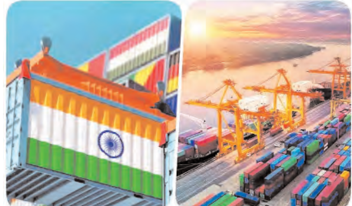
कारोबार होता है। इस युद्ध का इसपर क्या असर पड़ सकता है।

नई दिल्ली, एजेंसी। ईरान ने इजरायल पर अटैक किया है। इसके बाद से दोनों देशों के बीच तनाव की स्थिति बनी हुई है। इस युद्ध का असर कई देशों पर पड़ सकता है। ईरान ने इजरायल पर शनिवार देर रात सैकड़ों ड्रोन, कर्जुज मिलाइल और बैलिस्टिक मिसाइलों से हमला किया है। इस हमले के बाद से मध्य-पूर्व में तनाव अपने चरम पर पहुंच गया है। ईरान और इजरायल के बीच युद्ध तेज होने की आशंका से पूरी दुनिया सहमी हुई है। ईरान और इजरायल युद्ध का असर भारत पर देखने को मिल सकता है। अगर दोनों देशों के बीच जंग छिड़ती है तो इससे न केवल भारत में महंगाई बढ़ने का खतरा है, बल्कि शेयर बाजार पर नकारात्मक असर होने की आशंका जताई जा रही है। भारत के दोनों ही देशों से कारोबारी संबंध हैं। ऐसे में इस युद्ध से भारत के कारोबार पर असर पड़ सकता है। आइए जानते हैं भारत के ईरान और इजरायल के साथ कैसे कारोबारी संबंध हैं। दोनों के बीच कितना