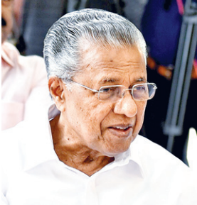
केरल के मुख्यमंत्री पिनाराई विजयन ने कन्नूर में लोकसभा चुनाव के दूसरे चरण में अपना वोट डाला।