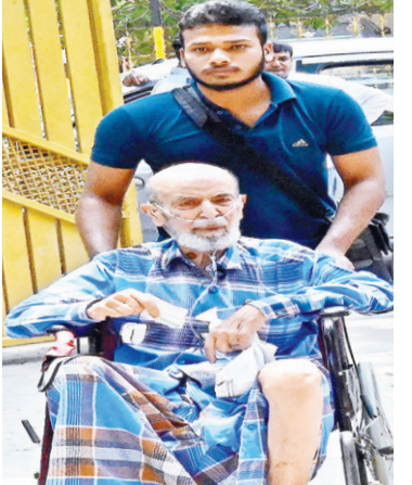
बेंगलुरु के गोविंदराज नगर मतदान केंद्र पर लोकसभा चुनाव के दूसरे चरण में वोट डालने के लिए व्हीलचेयर पर पहुंचे एक बुजुर्ग मतदाता।