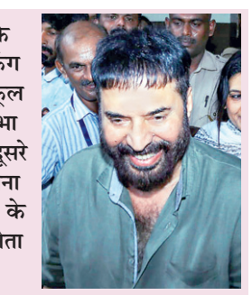
कोच्चि के क्राइस्ट किंग कॉन्वेंट स्कूल में लोकसभा चुनाव के दूसरे चरण में अपना वोट डालने के बाद अभिनेता ममूटी।