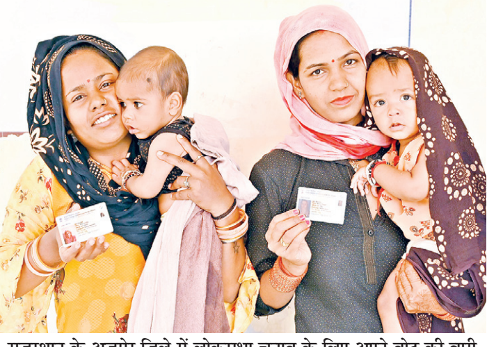
राजस्थान के अजमेर जिले में लोकसभा चुनाव के लिए अपने वोट की बारी का इंतजार करते समय अपना पहचान पत्र दिखाती महिलाएं।