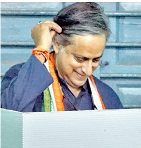
कांग्रेस उम्मीदवार शशि थरूर ने तिरुवनंतपुरम में लोकसभा चुनाव के दूसरे चरण में अपना वोट डाला।