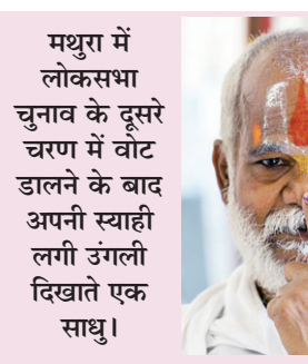
मथुरा में लोकसभा चुनाव के दूसरे चरण में वोट डालने के बाद अपनी स्याही लगी उंगली दिखाते एक साधु।