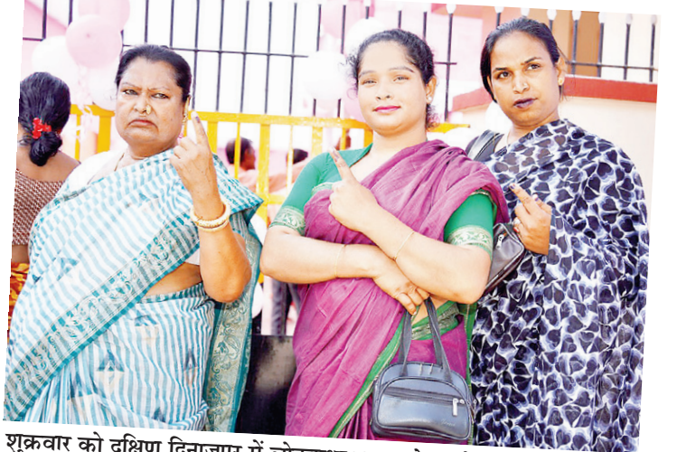
शुक्रवार को दक्षिण दिनाजपुर में लोकसभा चुनाव के दूसरे चरण के लिए वोट डालने के बाद ट्रांसजेंडर मतदाता अपनी स्याही लगी उंगलियां दिखाते हुए।

कराकर सहायता प्रदान करते हुए मतदान कराया गया। गौतमबुद्धनगर की तीन विधानसभा नोएडा, दादरी एवं जेवर में शांतिपूर्ण मतदान हुआ। कमिश्नर गौतमबुद्ध नगर पुलिस द्वारा सभी मतदान केंद्रों पर पारदर्शिता एवं निष्पक्षता के साथ आदर्श आचार संहिता का अनुपालन करते हुए शांतिपूर्ण मतदान कराया गया।