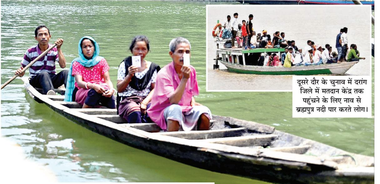
लोकसभा चुनाव के दूसरे चरण में त्रिपुरा के धलाई में एक मतदान केंद्र पर वोट डालने के लिए नाव से पहुंचे मतदाता।