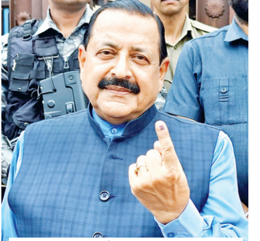
केंद्रीय मंत्री और भाजपा उम्मीदवार जितेंद्र सिंह, शुक्रवार को जम्मू में लोकसभा चुनाव के दूसरे चरण के लिए वोट डालने के बाद अपनी स्याही लगी उंगली दिखाते हुए।

बुजुर्ग मतदाताओं के लिए थी विशेष व्यवस्था अलग-अलग क्षेत्र में पहुंचने वाले बुजुर्ग मतदाताओं के लिए विशेष चुनाव कर्मा भी तैनात किए गए हैं। यहां दिव्यांगों का विशेष ध्यान रखा जा रहा है। उन्हें जरूरत के हिसाब से व्हील चेयर उपलब्ध कराई जा रही है और उनका मतदान करवाया जा रहा है। लोकसभा चुनाव के दूसरे चरण में शुक्रवार को केरल की सभी 20 लोकसभा सीटों पर चुनाव हो रहा है। वहीं, कर्नाटक की 14, राजस्थान की 13, उत्तर प्रदेश की 8, महाराष्ट्र की 8, मध्य प्रदेश की 6, असम की 5, बिहार की 5, छत्तीसगढ़ की 3, पश्चिम बंगाल की 3 और त्रिपुरा, मणिपुर एवं जम्मू कश्मीर की 1-1 सीट पर मतदान हो रहा है। इस चरण में चुनाव लड़ने वालों में केरल के वायनाड से राहुल गांधी, तिरुवनंतपुरम से कांग्रेस के शशि थरूर मैदान में हैं। शशि थरूर का मुकाबला केंद्रीय मंत्री और भाजपा के उम्मीदवार राजीव चंद्रशेखर से है। मथुरा से हेमा मालिनी, राजनांदगांव से भूपेश बघेल, बेंगलुरु ग्रामीण से डीके सुरेश और बेंगलुरु दक्षिण से तेजस्वी सूर्या चुनाव लड़ रहे हैं। राजस्थान के कोटा सीट से लोकसभा स्पीकर ओम बिड़ला बीजेपी के टिकट पर चुनाव लड़ रहे हैं।