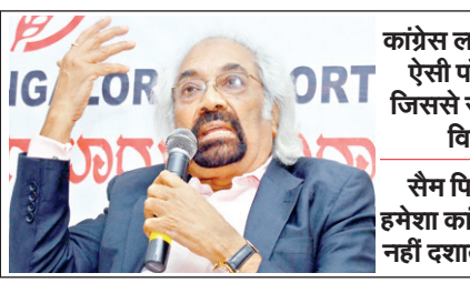
कांग्रेस लगातार कह रही है ऐसी पॉलिसी बनाएंगे जिससे संपत्ति का समान वितरण होगा

इंडियन ओवरसीज कांग्रेस के अध्यक्ष सैम पित्रोदा ने विरासत टैक्स पर बयान दिया है। चुनावी मौसम में इस मुद्दे पर पहले ही विवाद हो रहा है। सैम के ताजा बयान पर चौराफा हमला शुरू हो गया है। इसके बाद कांग्रेस ने सैम पित्रोदा से किनारा कर लिया है। पार्टी का कहना है कि ऐसा नहीं है कि पित्रोदा के विचार हमेशा भारतीय राष्ट्रीय कांग्रेस को दर्शाते हैं। कई बार उनके विचार कांग्रेस पार्टी के विचार नहीं होते हैं। गौरतलब है कि कांग्रेस सांसद राहुल गांधी ने पिछले दिनों कहा था कि अगर उनकी सरकार आई तो वित्तीय और संस्थानिक सर्वे कराएंगे। हम ये पता लगाएंगे कि देश की दौलत किसके पास है। इसके बाद हम ऐतिहासिक कदम उठाएंगे। हम क्रांतिकारी कदम उठाते हुए ये सुनिश्चित करेंगे कि आपका अधिकार आपको मिले। उनके इस बयान पर सैम पित्रोदा ने अमेरिका के विरासत टैक्स का जिफ्र