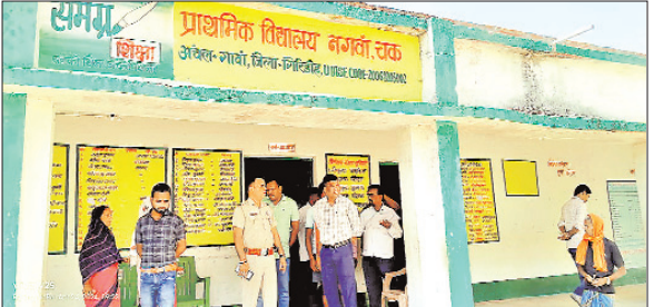
व्यवस्थाओं को सुदृढ़ रखने के लिए संबंधित पदाधिकारी को निर्देशित किया

बूथों पर शौचालय, पेयजल, दिव्यांग मतदाताओं के लिए रैम्प की व्यवस्था होगी