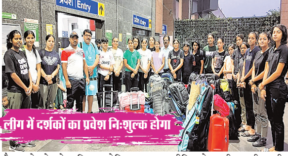
लीग में दर्शकों का प्रवेश नि:शुल्क होगा

नवीन खेल संवाददाता। रांची। मोहाबादी का मरांग गोमके जयपाल सिंह एस्ट्रेटफ स्टेडियम एक बार फिर गुलजार होने वाला है। यहां 30 अप्रैल से पहली राष्ट्रीय महिला हॉकी लीग होगी, जो नौ मई तक चलेगी। इस लीग में देशभर के आठ राज्यों की टीमों हिस्सा लेंगी।