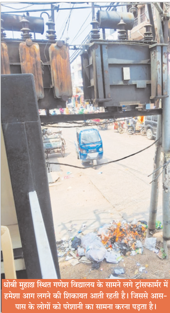
श्रीवाही मुहल्ला स्थित गणेश विद्यालय के सामने लगे ट्रांसफार्मर में हमेशा आग लगने की शिकायत आती रहती है। जिससे आस-पास के लोगों को परेशानी का सामना करना पड़ता है।

में उल्टी, दस्त व बुखार की शिकायत है। वहीं बुजुर्गों को सांस लेने में हाल के दिनों में काफी परेशानी हो रही है।