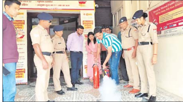
फायर डेमो कर और व्यापक रूप में जागह जागह पर अग्नि सुरक्षा और रोकथाम के पंपलेट वितरित किए गए।

जनपद के विद्यालयों में शिक्षा में नवाचार अन्तर्गत औषधीय पादप वाटिका का हो निर्माण : डीआईओएस