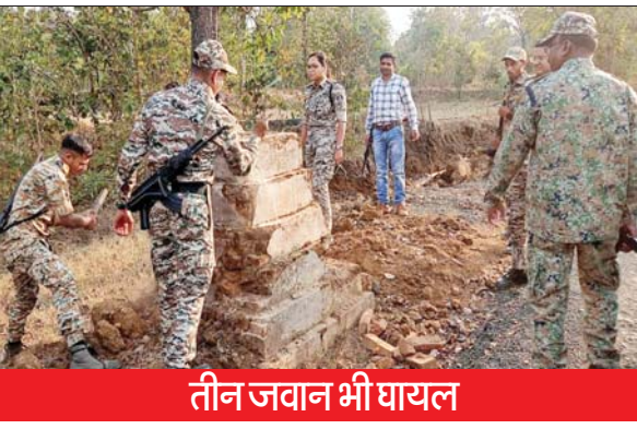
तीन जवान भी घायल

छत्तीसगढ़। छत्तीसगढ़ के कांकेर जिले में मंगलवार को मुठभेड़ के दौरान कम से कम 29 माओवादी मारे गए और कम से कम तीन जवान घायल हो गए। यह घटना 2024 के लोकसभा चुनाव शुरू होने से कुछ दिन पहले की है। समाचार एजेंसी एएनआई से बात करते हुए वरिष्ठ पुलिस अधिकारी आईके एलेसेला ने कहा कि इलाके में मुठभेड़ अभी भी जारी है।