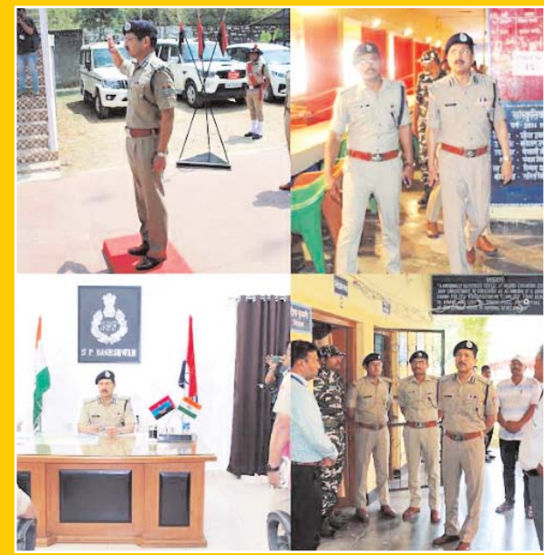
द्वारा आचार संहिता लागू होने से अब तक जनपद पुलिस द्वारा की गयी सभी निरोधात्मक कार्यवाहियों के बारे में जानकारी एवं चुनाव को सक्षम सम्पन्न कराये जाने, आचार संहिता का पूर्ण रूप से पालन करने/कराये