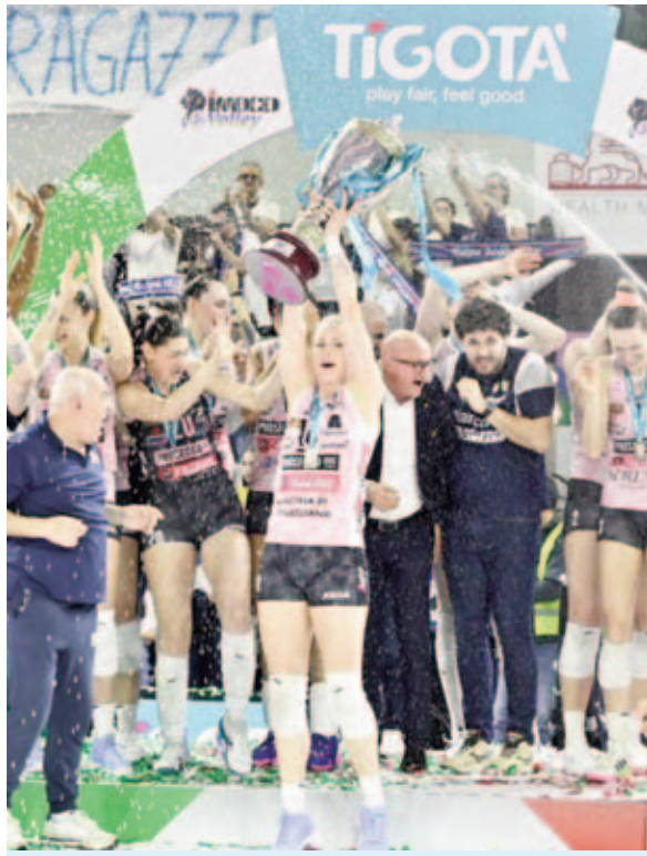
इटली में कोनेजिलियानो टीम के सदस्य सीरीज 1 महिला वालीबाल लीग में जीत के बाद ट्रॉफी के साथ नजर आये।