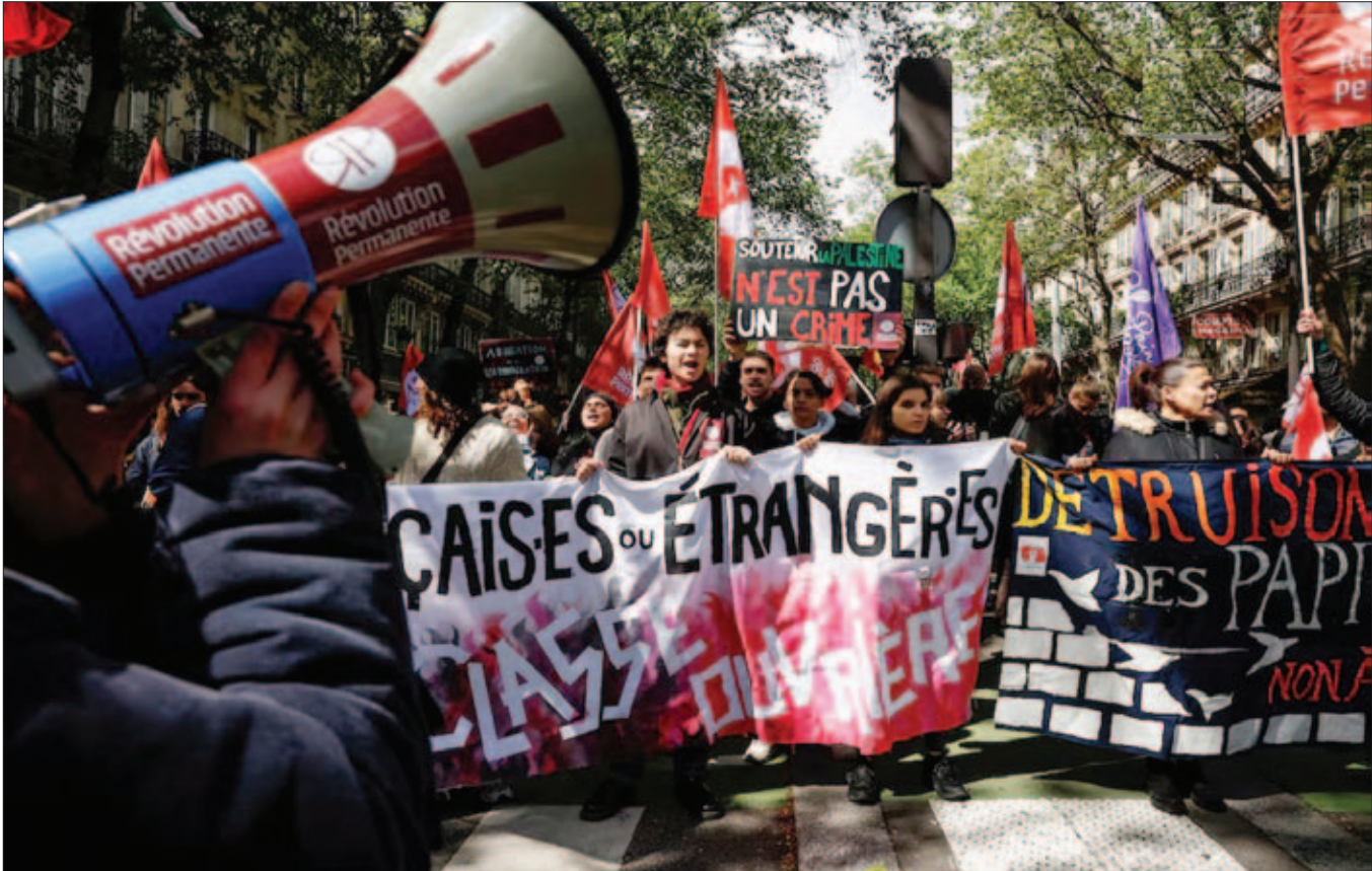
पेरिस में लोग नस्लवादी हिंसा के विरोध ओर बच्चों की सुरक्षा को लेकर एक प्रदर्शन में शामिल हुए।