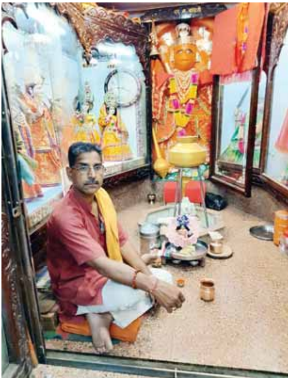
पाठ आरंभ होगा। तत्पश्चात महा आरती एवं छप्पन भोग का दर्शन प्रातः काल