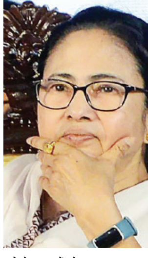
लगे थे। राज्य में लोकसभा चुनाव 7 चरणों में कराए जा रहे हैं।

विपक्षी नेताओं में भाजपा से मुकाबला करने का जोश तो बहुत पहले ठण्डा हो चुका था जब इंडिया गठबंधन के घटक दल अलग हो गये थे। विशेष रूप से नीतीश कुमार अपनी पार्टी जद(यू) के साथ अलग हो गये और भाजपा के साथ मिलकर सरकार बना ली। इसी तरह पश्चिम बंगाल में ममता बनर्जी अकेले पड़ गयी थी क्योंकि कांग्रेस ने वामपंथी दलों के साथ समझौता किया। इतना ही नहीं कांग्रेस और माकपा के नेता ममता सरकार के हर कदम का विरोध करते थे। इसलिए ममता बनर्जी ने अकेले दम पर आम चुनाव 2024 में भाजपा से मुकाबले की तैयारी की और वह मुकाबले में दिख भी रही थीं लेकिन कलकत्ता हाईकोर्ट के एक फैसले ने चुनाव के दरम्यान ममता बनर्जी को ज़ोर का झटका दिया है। भाजपा ममता बनर्जी की सरकार को भी भ्रष्टाचार के मुद्दे पर धरना चाहती थी क्योंकि आम आदमी पार्टी के नेता आदिब केजरीवाल, झारखंड मुक्ति मोर्चे के नेता और झारखंड के पूर्व मुख्यमंत्री हेमंत सोरेन, बिहार के पूर्व मुख्यमंत्री लालू प्रसाद यादव जैसे नेताओं पर भाजपा भ्रष्टाचारी होने का खुलकर आरोप लगा ही रही थी। अब कलकत्ता हाईकोर्ट ने पश्चिम बंगाल में शिक्षक भर्ती परीक्षा-2016 को रद्द घोषित कर दिया है। भाजपा इस घोटाले को चुनाव का मुद्दा पहले से ही बनाए हुए थी। शिक्षक भर्ती घोटाले में ही पंवातन निदेशालय (ईडी) 230 करोड़ रुपये की प्राप्ती जब्त कर रखी है। कई जगह छापेमारी भी की गयी है। ध्यान रहे कि 2016 में 24640 रिक्त पदों पर 23 लाख से अधिक अभ्यर्थियों ने एएसएलएस्टी परीक्षा दी थी। भर्ती प्रक्रिया में अनियमितता के आरोप