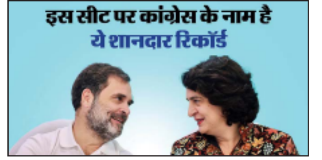
इस सीट पर कांग्रेस के नाम है ये शानदार रिकॉर्ड

वर्ष 1952 में मुरादाबाद की दो लोकसभा सीटों मुरादाबाद (सेंट्रल) व मुरादाबाद पर हुए चुनाव में कांग्रेस प्रत्याशी क्रमशः 60 फीसदी तथा 47.6 फीसदी मत प्राप्त कर विजयी घोषित हुए थे। इसके अलावा 13 अन्य चुनावों में भी कांग्रेस उम्मीदवारों ने अपनी किस्मत आजमाई, लेकिन अधिकांश बार हुए चुनाव में कांग्रेस