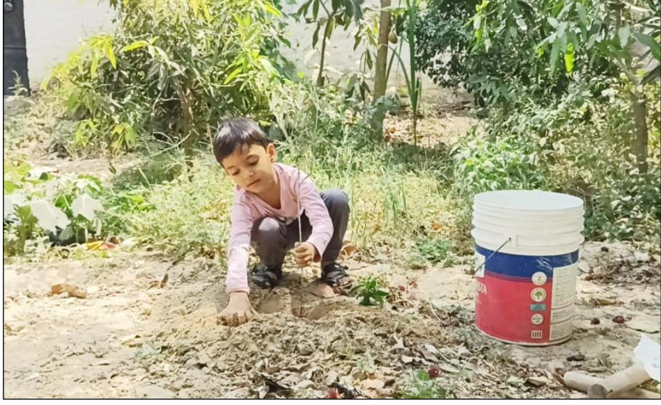
द्वारा लगाए गए कई वृक्ष फलदार एवं छायादार हो चुके हैं जिसका