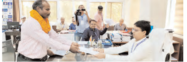
इन अर्न्धियों ने खरीदा नामिनेशन फॉर्म