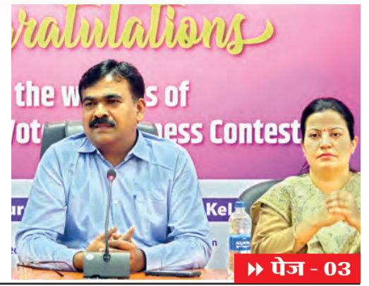
पेज - 03