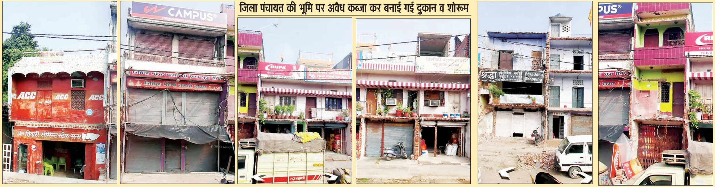
जिला पंचायत की भूमि पर अवैध कब्जा कर बनाई गई दुकान व शोरूम