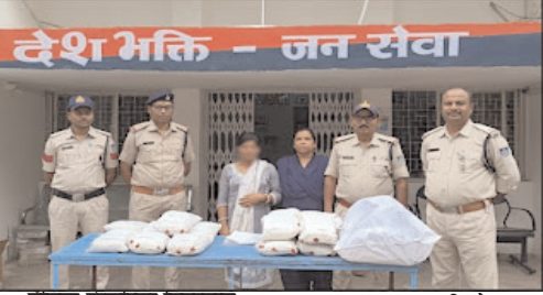
दैनिक केसरिया हिन्दुस्तान

*अनूपपुर* कोतमा थाना क्षेत्र में पुलिस ने बस स्टैंड अनूपपुर से 36 वर्षीय महिला को दो ट्रॉली बैग में भरे 15 किलो से अधिक गांजा अनुमानित कीमत 1.52 लाख रूपए के साथ पकड़ते हुए उसके खिलाफ धारा धारा 8/20 बी के