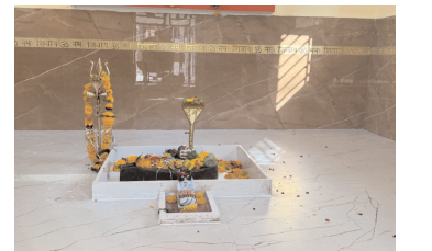
महाप्रसादी वितरण का भी आयोजन किया गया है।