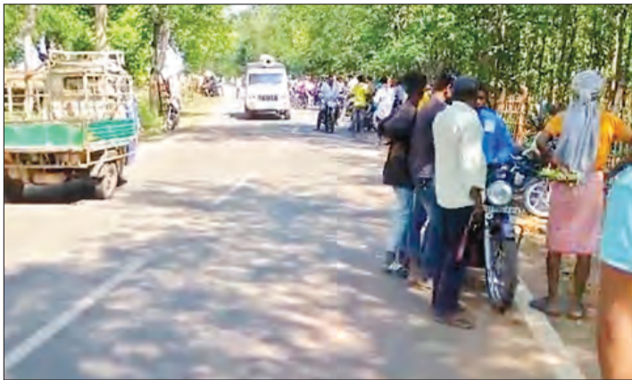
हाथियों को देखने के लिए उमड़ी मीड़ व पतरा में डेरा जमाए हाथियों का झुंड।