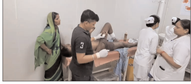
लोकतंत्र की आवाज