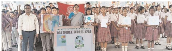
जोड़पोखर (ससे) : सोमवार को डीएवी मॉडल स्कूल सीएफएस छात्रों ने विश्व पृथ्वी दिवस धूमधाम से मनाया गया। इस अवसर पर छात्रों के लिए विभिन्न गतिविधियाँ का

आयोजन किया गया। सबसे पहले स्कूल प्राणियों तथा में विश्व पृथ्वी दिवस धूमधाम से मनाया गया। इस अवसर पर छात्रों के लिए विभिन्न गतिविधियाँ का