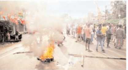
लगाया कि राज्य के सत्तारूढ़ दल के कार्यकर्ता लोगों को धमकाने और मतदान से रोकने का प्रयास करते रहे। वहीं अयोग रणमूल कायों ने भी भाजपा कार्यकर्ताओं पर लगाए। उदाहरणों की

आम चुनाव के पहले चरण का मतदान संपन्न हो गया। ज्यादातर इलाकों में तेज गमी के बावजूद लोगों में मतदान को लेकर उत्साह देखा गया। हालांकि कुछ जगहों पर हिंसक घटनाओं ने जरूर लोकतंत्र के इस उत्सव को बदरंग करने की कोशिश की, पर अच्छे खास है कि उससे मातृदत्ताओं और मतदान की प्रक्रिया पर बहुत नकारात्मक असर नहीं देखा गया। मणिपुर लंबे समय से जातीय हिंसा की चोंच में है और वहां पहले से चुनाव के विरोध का चरम उदाहरण रहा था। इसीलिए आम चुनाव के प्रारंभिक चरणों पर उपेक्षा की घटनाएं हुईं, तो इसकी वजह समझी जा सकती है। यहां चुनाव कराना निश्चिंत आयोग के सामने बड़ी चुनौती थी। इसके अलावा छत्तीसगढ़ के बीजापुर में एक मतदान केंद्र के पास नक्सलियों ने विस्फोट किया।