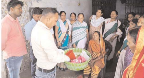
कोलियरी में ४५ फाउंडेशन मरीजों को एमएमडीपी किट का वितरण किया गया। इस कार्यक्रम में उपस्थित रिपारल

मरीज को बताया गया कि इसका उपयोग कैसे करें। किट में प्लास्टिक का टब, साबुन,