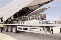
भारत से फिलीपींस तक ब्रह्मोस मिसाइल की आपूर्ति जारी

फिलीपींस, एजेंसी। रक्षा अधिकारियों ने कहा कि 375 मिलियन अमेरिकी डॉलर के सौदे के तहत भारत से फिलीपींस को ब्रह्मोस सुपरसोनिक ब्रह्मोस मिसाइलों की आपूर्ति दोनों देशों के बीच अनुबंध के हिस्से के रूप में जारी है। मिसाइल प्रणाली की आपूर्ति विचार को एक चार्टर्ड इल्युशि-76 परिवहन विमान में भारत से मनीला के एक हवाई अड्डे पर पहुंचे। रक्षा अधिकारियों ने आगे कहा कि भारत और फिलीपींस के अधिकारी अनुबंध के तहत उस देश को आपूर्ति किए हुए उपकरणों की पहली खेप प्राप्त कर रहे हैं। विशेष रूप से भारत ने 2022 में इस्तांबुल सौदे के हिस्से के रूप में 19 अंशों को फिलीपींस को सुपरसोनिक ब्रह्मोस मिसाइलों की पहली खेप सीपी। रक्षा सूत्रों के अनुसार, भारतीय वायु सेना ने फिलीपींस के मरीन कोर को इतिहास प्रणाली पहुंचाने के लिए अमेरिकी मूल सी-17 ग्लोबमास्टर परिवहन विमान को मिसाइलों के साथ फिलीपींस भेजा था। मिसाइलों के साथ-साथ ब्रह्मोस सुपरसोनिक ब्रह्मोस मिसाइल प्रणाली के लिए ग्राउंड सिस्टम का निश्चित पिछले महीने ही शुरू हुआ था। फिलीपींस ऐसे समय में मिसाइल प्रणालियों की इतिहासी ले रहा है जब दक्षिण चीन सागर में लगातार झड़पों के कारण उनके और चीन के बीच तनाव बढ़