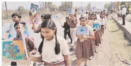
विश्व पृथ्वी दिवस उत्सव

शिक्षकनिधिकाओं ने हाथों की मदद से विद्यार्थियों को पृथ्वी की मिट्टिल स्कूल तक जागरूकता रैली निकाली। साथ ही छात्रों ने अपने विचारों, परिवर्णन के महत्व को समझाने का प्रयास किया है।