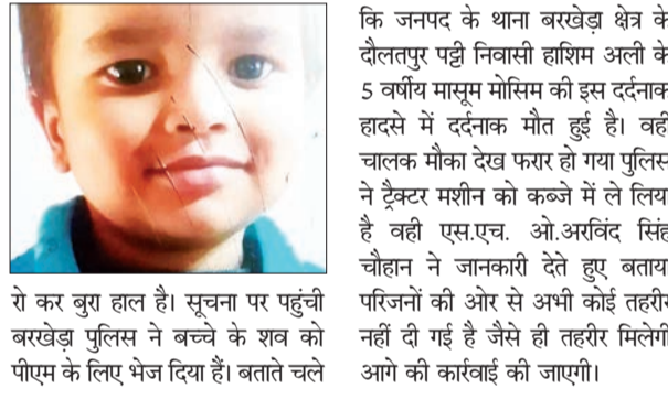
रो कर बुरा हाल है। सूचना पर पहुंची बरखेड़ा पुलिस ने बच्चे के शव को पीएम के लिए भेज दिया है। बताते चले