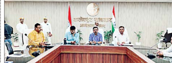
जन एक्सप्रेस। अम्बेडकर नगर

लोकसभा सामान्य निर्वाचन की घोषणा के उपरांत जिला निर्वाचन अधिकारी अविनाश सिंह की उपस्थिति में लोकसभा सामान्य निर्वाचन को नियंत्रण, पारदर्शी व सक्षुशल संचरण हेतु प्रशिक्षण कार्यक्रम कलेक्ट्रेट सभागार में आयोजित किया गया। सामान्य निर्वाचन प्रक्रिया एवं इलेक्ट्रॉनिक मॉडिंग से संबंधित संपूर्ण प्रक्रिया का प्रशिक्षण 125 मास्टर ट्रेनरों को दिया गया। जिसमें मास्टर ट्रेनरों से पूर्व में कराई गई ट्रेनिंग के बारे में पूछा गया। मास्टर ट्रेनरों द्वारा दिए गए जवाब से अधिकारी संतुष्ट दिखाई दिए। जिला निर्वाचन अधिकारी ने मास्टर ट्रेनरों को आवश्यक दिशा निर्देश दिए।