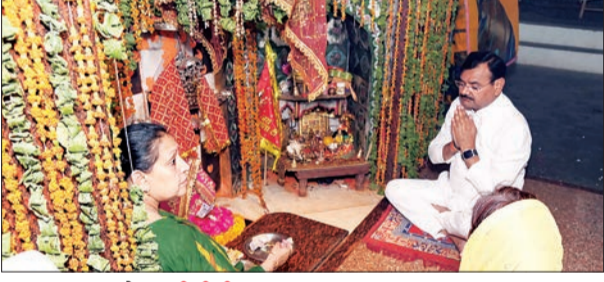
जन एक्सप्रेस। पीलीभीत