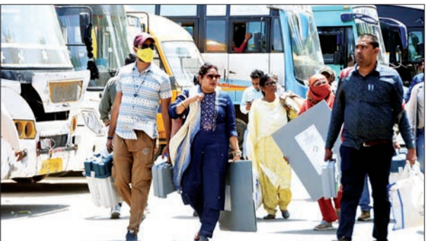
पीलीभीत लोकसभा सीट में मतदाता