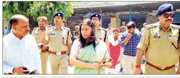
मंडलायुक्त पुलिस महानिरीक्षक जिला निर्वाचन अधिकारी ने लिया जाएगा