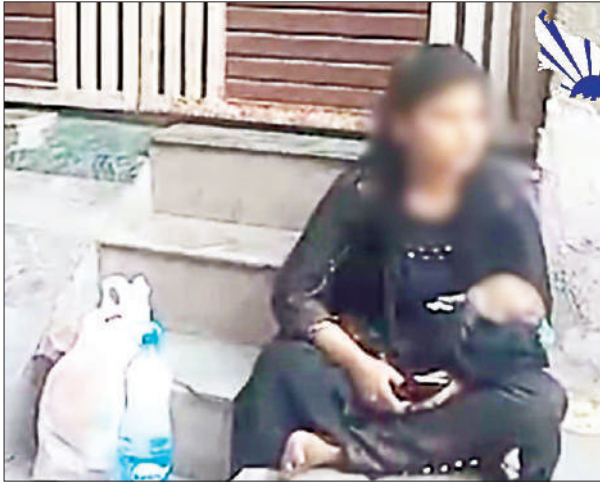
एक युवती से संबंध हैं। वह उसे घर में लाना चाहता है। ससुर अश्लील हरकत करता है। विरोध पर घर में

पर धरने पर बैठ गईं। थाना शाहगंज के सराय ख्वाजा में विवाहिता को दो महीने की बेटी के साथ ससुरालियों ने घर से निकाल दिया है। घर में प्रवेश के लिए बहू ससुराल के गेट पर ही धरने पर बैठ गई है। सूचना पर पुलिस भी पहुंची, लेकिन सास ने गेट नहीं खोला। इस कारण पुलिस को भी बैरंग लौटना पड़ा। मामले में व्हेज उपीडन सहित अन्य धाराओं में मुकदमा दर्ज किया गया है। पीड़िता को पुलिस ने 12 घंटे बाद रिश्तेदार के घर में उठराया है। विवाहिता शिकोहाबाद की रहने वाली है। तीन वर्ष पहले शाहगंज के युवक से शादी हुई थी। उसकी दो महीने की बेटी है। पीड़िता का कहना है कि पति राशन डीलर है। शादी के बाद से ही ससुराली परेशान कर रहे हैं। पति के