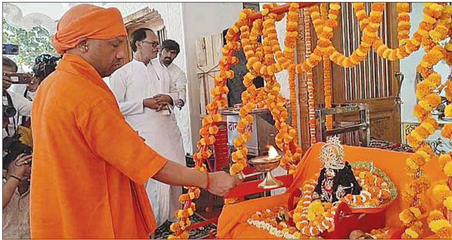
बाद आरती उतारी। पूजन का अनुष्ठान