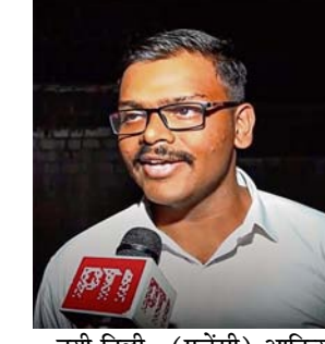
नयी दिल्ली, (एजेंसी) आदित्य

आदित्य शीर्ष पर, अनिमेष को दूसरा व अनन्या रेड्डी को तीसरा स्थान