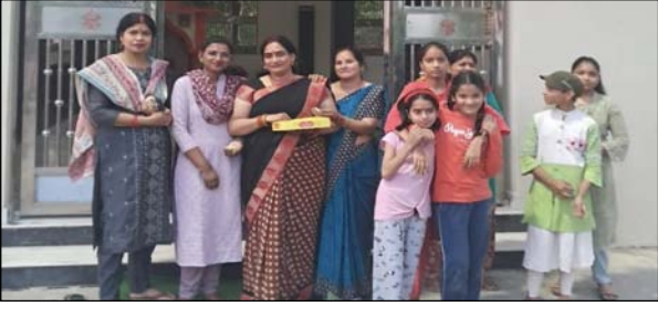
विपुल जैन / युरेशिया

बागपत। जिले में दुर्गाष्टमी श्रद्धापूर्वक मनाई गई। लोगों ने भजन-कीर्तन कर मां भगवती के आठवें रूप देवी महागौरी की विधि-विधान के साथ पूजा-अर्चना की। लोगों ने घरों में कन्याओं को भोजन कराया।